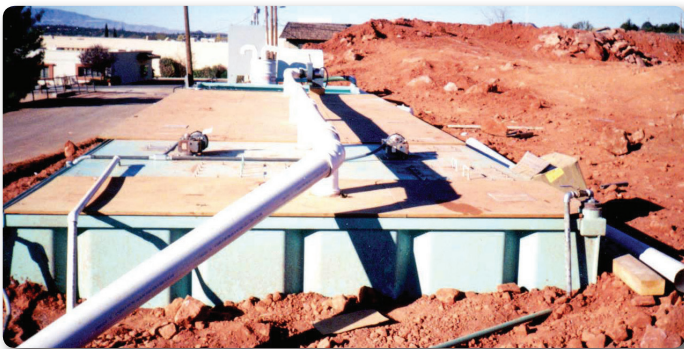
Protegida por la tierra, esta planta ADDIGEST® se encuentra semi-enterrada como se ilustra en esta fotografía.

Smith & Loveless se responsabiliza única y complemente, por el diseño y la ingeniería del producto así como su fabricación e instalación.