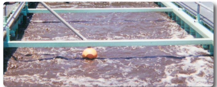
ADDIGEST® prueba a su capacidad en cientos de instalaciones.