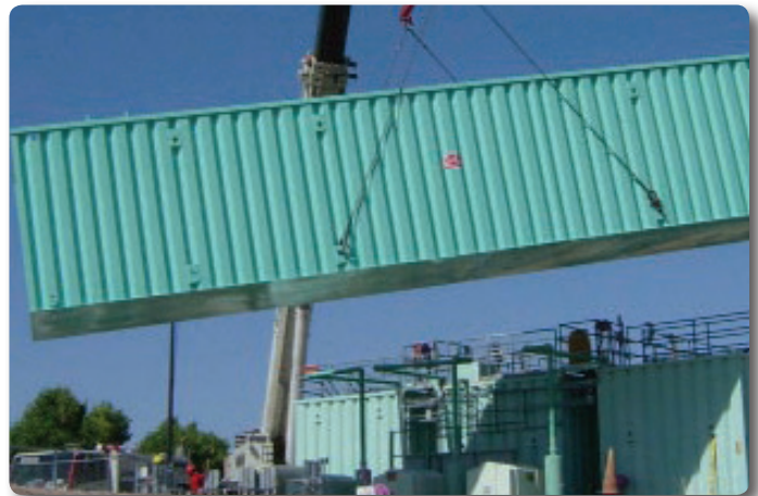
ADDIGEST® Instalaciones construidas en fábrica en trenes múltiples están disponibles como se aprecia en esta foto.